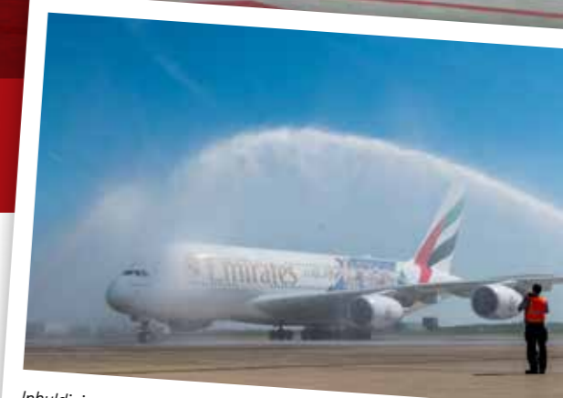
Inhuldiging op 19 april

Met de opening van de driedubbele instapbrug heeft Brussels Airport de eerste fase van het meerjarige investeringsplan