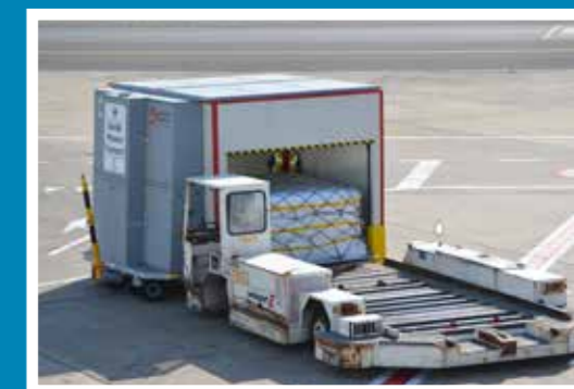
Airside pharma transporter

garantie van 5°C tot 25°C. De opvolging van de temperatuur is van cruciaal belang. De koelwagen werd ontworpen in samenwerking met alle partners op Brucargo en in overleg met enkele grote farmaceutische producenten met productie- of distributiecentra in België. Deze milieuvriendelijke ontwikkeling onderscheidt Brussels Airport als voorkeursluchthaven voor temperatuurgevoelig transport in Europa. Momenteel zijn er op de luchthaven vier transporters in gebruik.